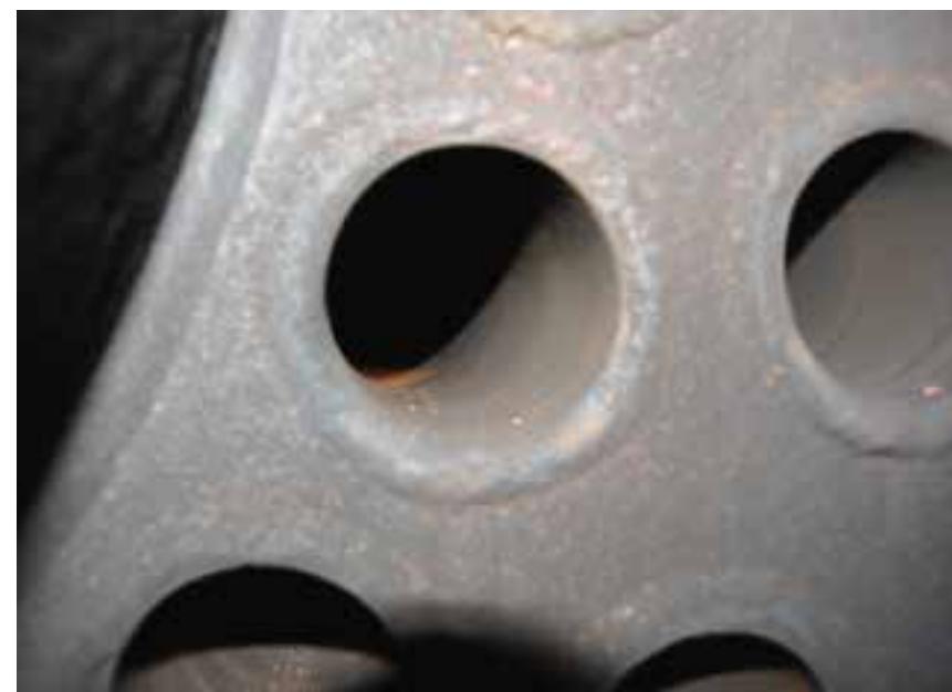
Huoltoon avatun Koivikon Puutarhan lämmityskattilan putkissa on hyvin vähää nokea ja muuta likaa, vaikka edellisestä puhdistuksesta on vuoden verran.