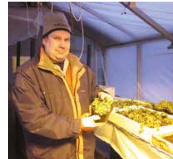
Koivikon Puutarhan kukkakauppa on kasvihuoneiden yhteydessä, joten siellä pidettyjä ruukkukasveja voi kätevästi siirtää kaupan esittelyyn menekin mukaan. Esan kädessä olevan kirjoliisukakin pysyy siten elinvoimaisena kuluttajalle asti.